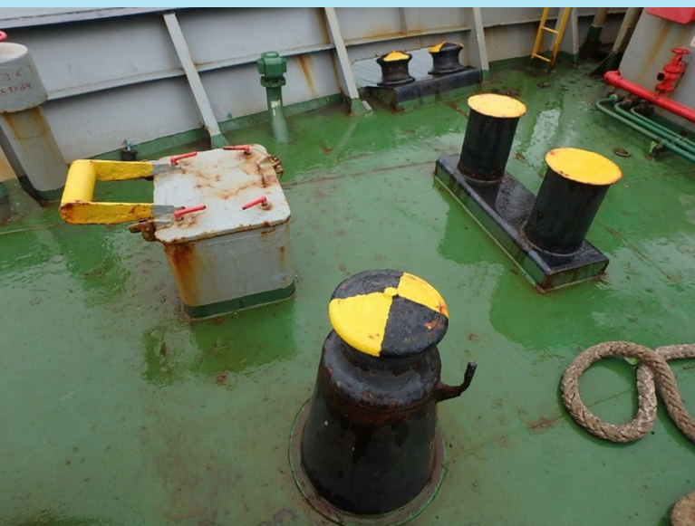
你在甲板上看到了什么？没看到什么？

在最近一项关于协会状况调查中所提到的缺陷研究中，人们发现，被提到的第三大缺陷与标签、标记和符号有关。标记、标签和符号被定义为船上项目，如安全出口路线、消防安全设备、通风口、管道、机器和设备、系泊设备的安全工作负荷（SWL）和起重机臂等的荧光标识。此外，还有关于明显缺失和磨损的荧光贴纸。